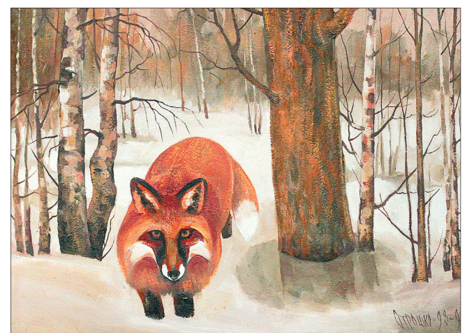
Время лисьих свадеб.