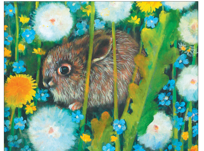
Зайчонок в одуванчиках.