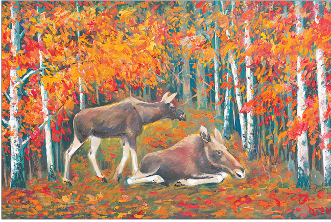
Лосиха с лосенком.