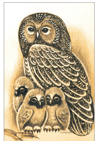
Сова с совятами.