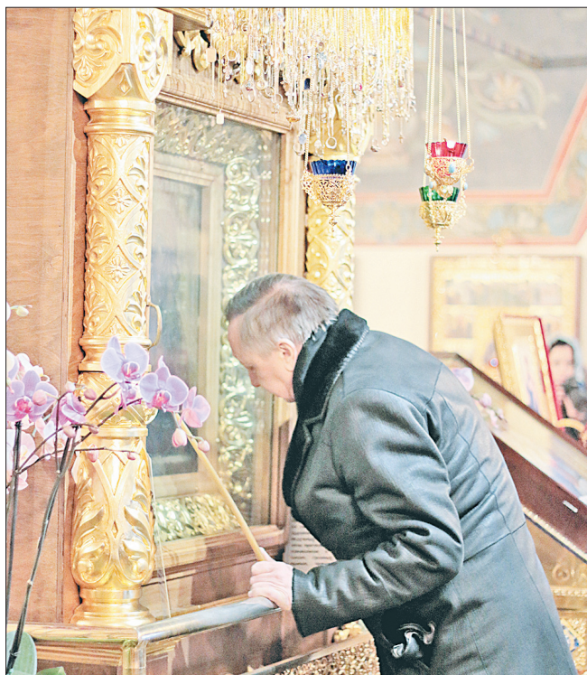
У чудодейственной иконы.

та России в Центральном федеральном округе Александр Беглов и помощник Президента Игорь Левитин.