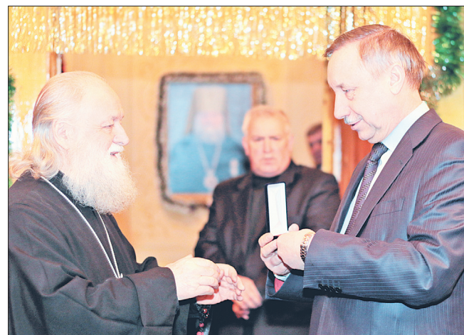
Митрополит Пантелеимон и Александр Беглов.