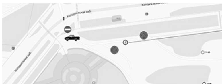
Схема расстановки временных дорожных знаков на 18.04.2021 в период проведения VII благотворительного полумарафона «Притяжение весны»

Приложение 1 к приказу директора департамента городского хозяйства от 02.04.2021 № 36