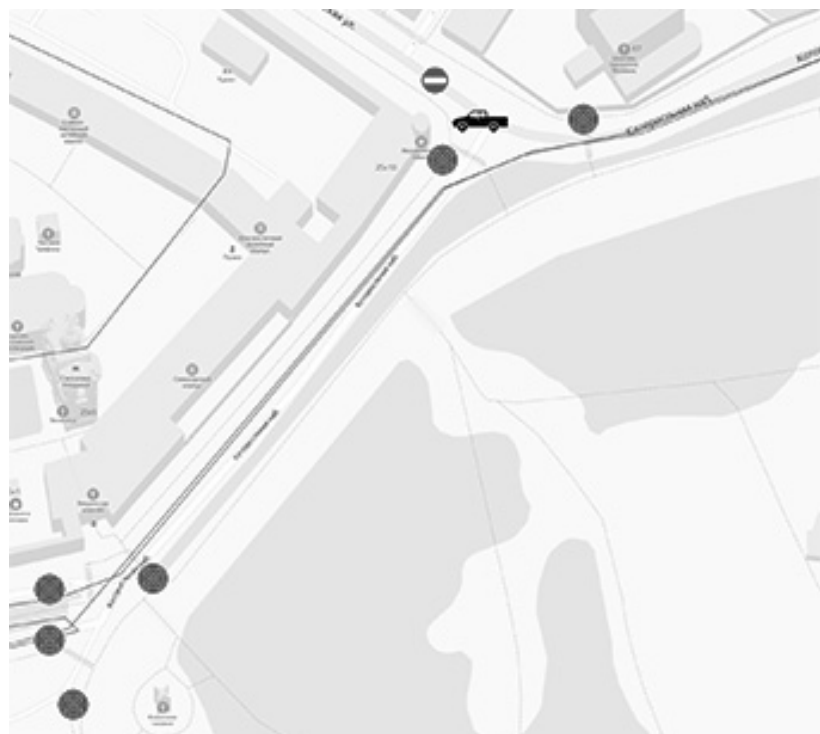
Схема расстановки временных дорожных знаков на 18.04.2021 в период проведения VII благотворительного полумарафона «Притяжение весны»