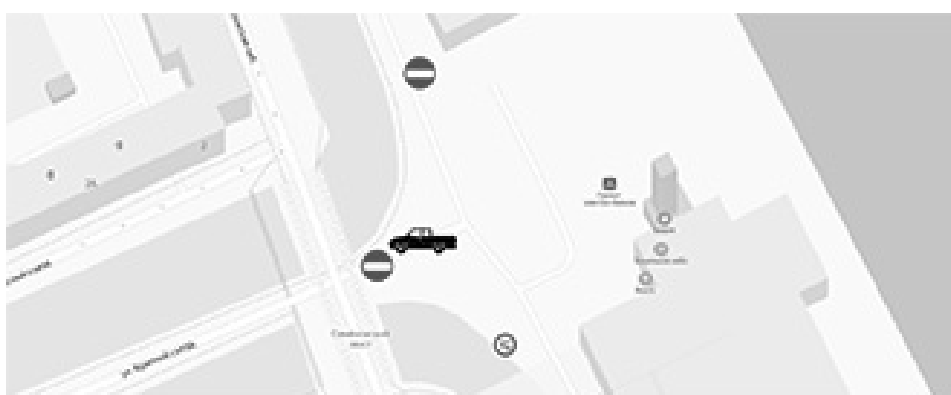
Схема расстановки временных дорожных знаков на 18.04.2021 в период проведения VII благотворительного полумарафона «Притяжение весны»

Приложение 4 к приказу директора департамента городского хозяйства от 02.04.2021 № 36