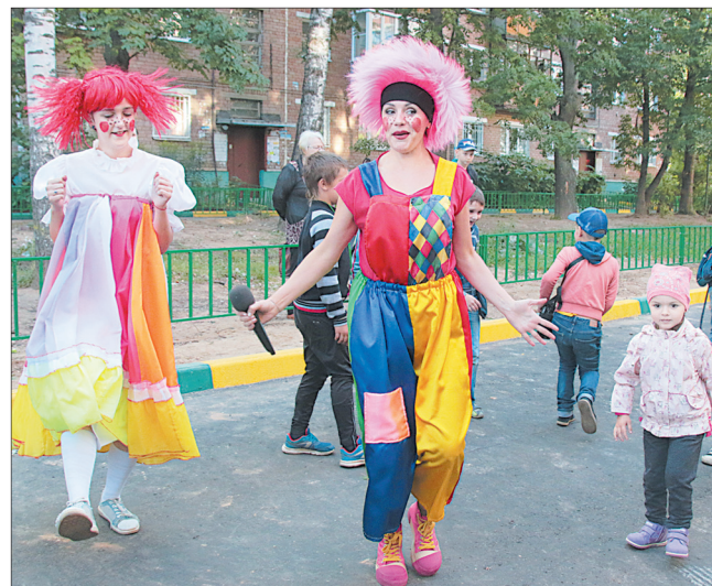
Праздник двора на улице Гоголя.

– С нами постоянно находился мальчонка из двора, – рассказывает рабочий, выполнявший ре-