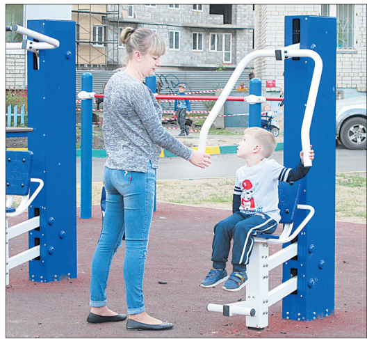
Во дворе на проспекте Фрунзе установлен воркаут.

К концу лета в Кировском и Ленинском районах окончены работы на 6 объектах: на улицах Чкалова, Максимова, Салтыкова-Щедрина, Терешковой, Советской и на Республиканском проезде. В Заволжском районе благоустроены 3 двора – на улицах Ранней, Орджоникидзе, проспекте Машиностроителей. В Дзержинском районе тоже 3 адреса – на улицах Труфанова, Урицкого и проспекте Моторостроителей. Во Фрунзенском отремонтированы 4 двора – на улицах Лескова, Гоголя, а также на проспекте Фрунзе и проезде Ушакова. В Краснопере-