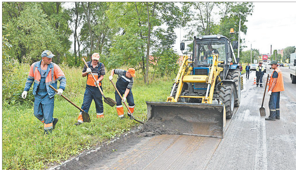
Карточный ремонт на улице Панина.