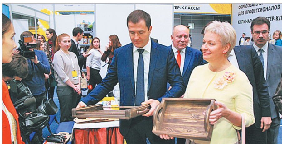
На праздновании Дня Золотого кольца в КСК «Вознесенский».

«Миллениум». На фестиваль представили более 150 работ в 10 номинациях не только города Золотого кольца, но и ближнего и даже дальнего зарубежья.