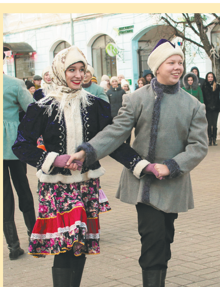
Участники танцевального ансамбля «Улыбка».