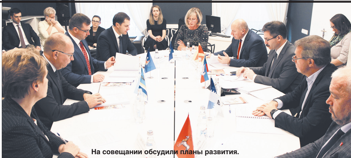
На совещании обсудили планы развития.

Победители определились вечером. Отлично, что первое и второе места заняли представители Ярославской области: команды из Углича и Ярославля. Лидеры – угличские кулинары – получают право участвовать во всероссийском турнире Chef a la Russe.