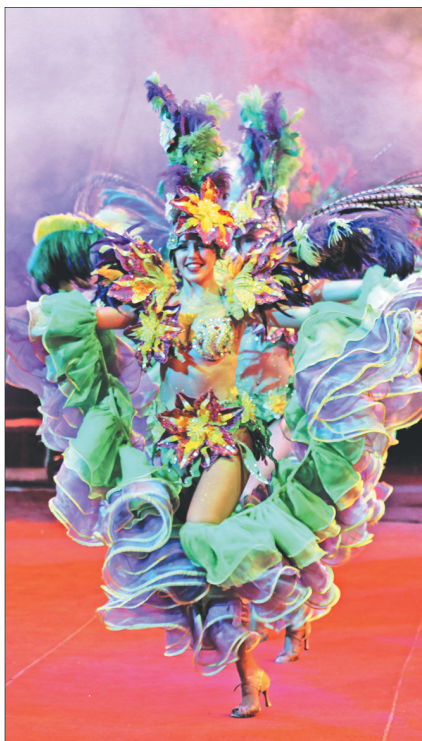
Без женщин жить нельзя в манеже, нет!