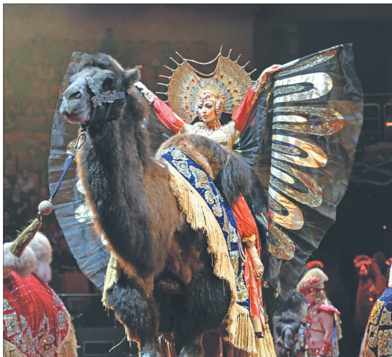
В гостях у шейха.