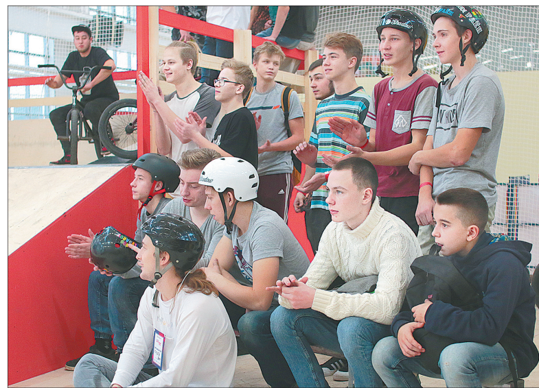
Зрители восхищались трюками.