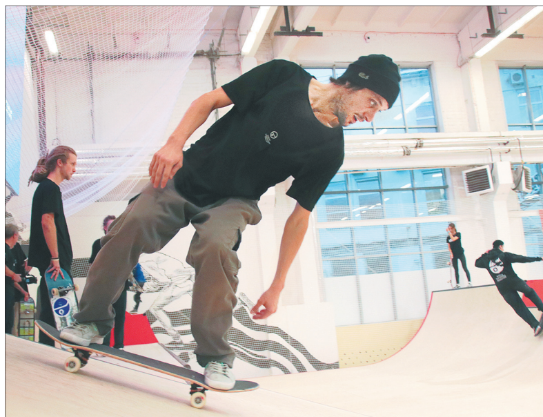
Фристайл на скейтборде.

Он продемонстрировал свое мастерство в дисциплине BMX.