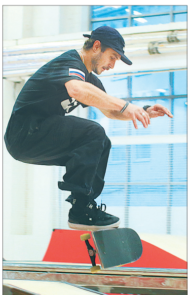
Скейтборд – это круто!

Этот парк с нетерпением ждали ярославские роллеры, паркурщики, скейтбордисты и другие любители уличных видов спорта.