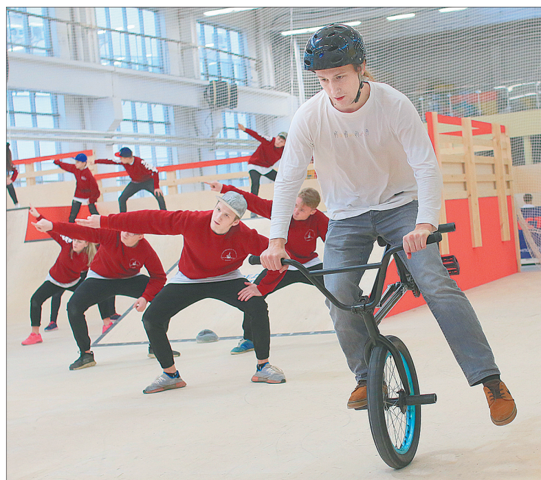
Выступление на моноцикле.