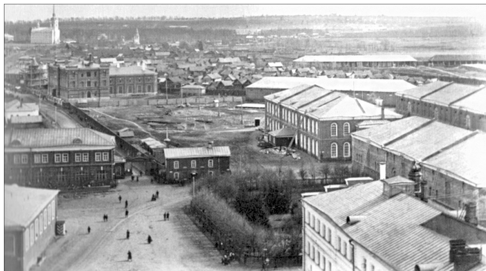
Рабочая слобода Ярославской Большой мануфактуры. Начало XX века.