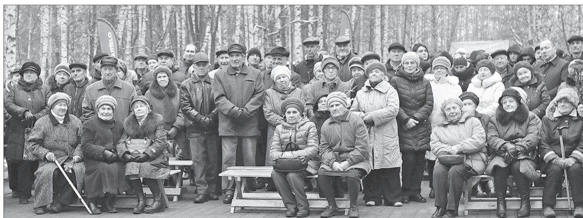
На торжественное открытие пришли комсомольцы разных лет.