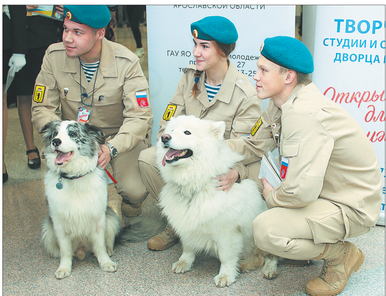
Проект «Собаки для детей».