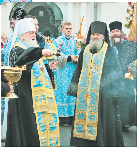
Окропление участников крестного хода.