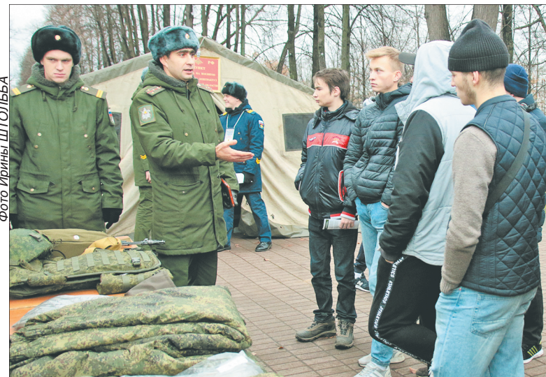
Мобильный пункт отбора граждан на военную службу.

Четырнадцать молодых людей изъявили желание поступить на военную службу по контракту в Вооруженные силы. Таков результат прошедшей 4 ноября акции «Военная служба по контракту – Твой выбор».