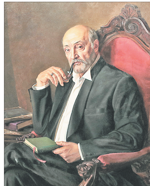
Народный артист России режиссер Михаил Козаков.