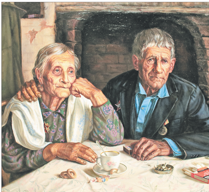
Это они защитили Родину.

стью, картина попала на все-союзную выставку. После нее Шорину дали однокомнатную квартиру на первом этаже.