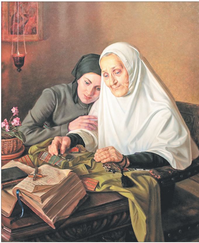
За веру и Отечество.