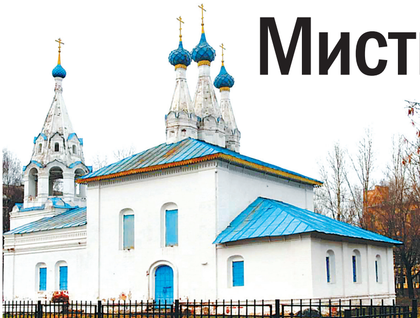
Церковь Владимирской Божией Матери.

Ярославль – город с богатой историей, так что легенды о призраках у нас широко распространены. Такие «нехорошие» дома есть практически в каждом районе Ярославля. И вот только некоторые из них