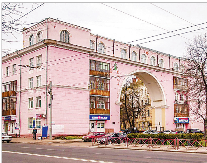
Дом на Красной площади.

На месте административно-офисного здания на улице Свободы, 2 в XX веке располагалась гостиница «Ярославль». Посто-