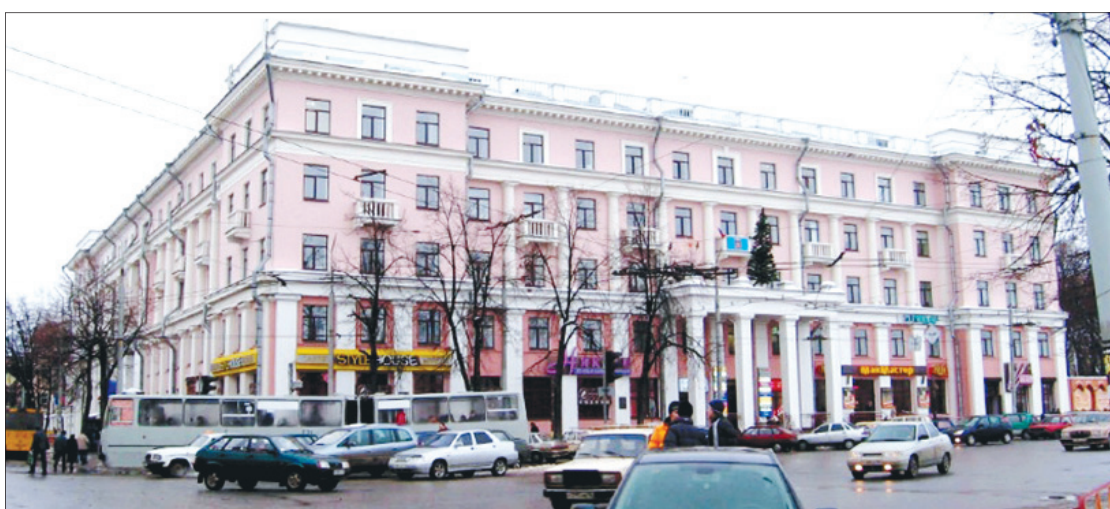
Здание на улице Свободы, 2.