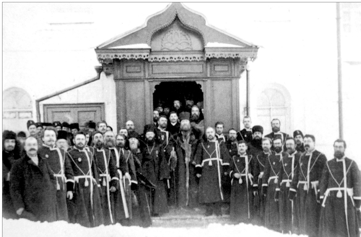
Священники Ярославской епархии. Начало XX века.

вился прекрасный хор. Одновременно на клиросе пели по 40 монахов. Так как все ярославские церкви были закрыты, послушать настоящую монашескую службу сюда приезжали многие верующие горожане.