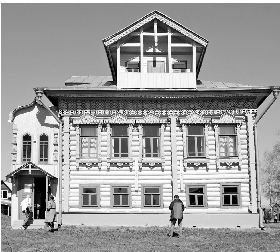
Дом-музей Опекушина в селе Рыбницы.

« 35 лет назад в селе Рыбницы был открыт Дом-музей скульптора-академика Александра Михайловича Опекушина. Это единственный в России музей, экспозиция которого посвящена жизни и творчеству великого русского скульптора, родившегося крепостным и добившегося звания академика исключительно собственным трудолюбием и талантом.