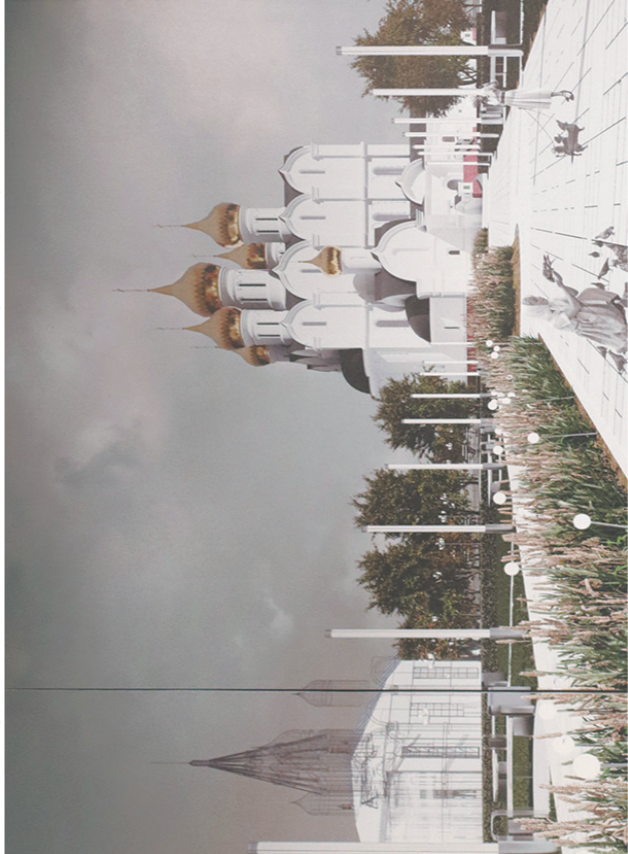
→ Такой видят Стрелку молодые архитекторы.