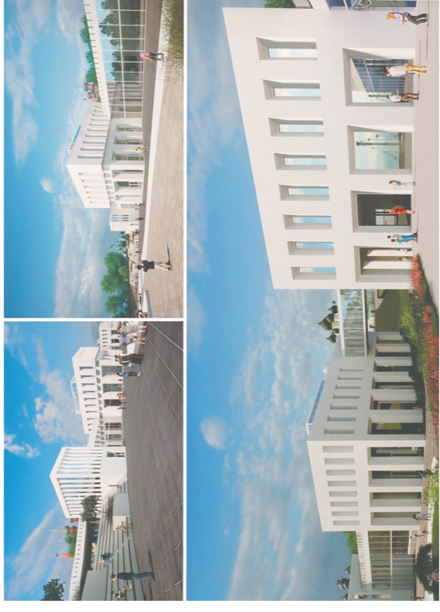
→ Музейный комплекс на Подзелье — в бетоне и асфальте.