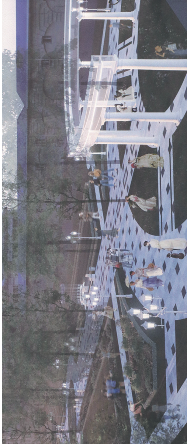
→ Первомайский бульвар может стать частью Большого театрального действия.