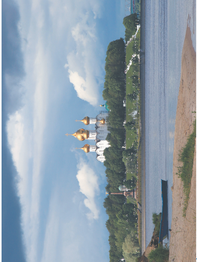
→ Современный вид на место слияния Волги и Которосли.