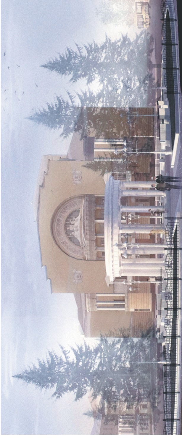
→ Перед зданием театра по задумке авторов может появиться ротонда.