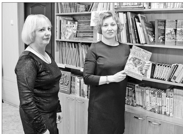
Библиотеке им. Ярослава Мудрого подарили книги на китайском языке.