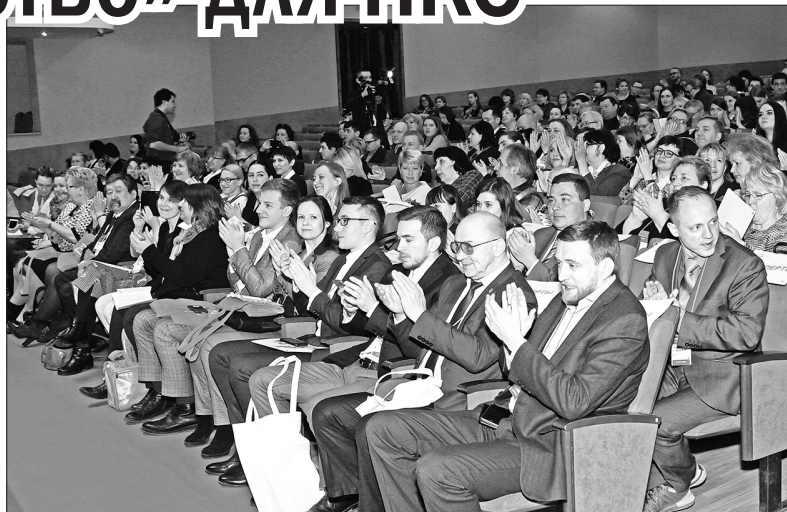
Зал был полон.

— В рамках инициатив, озвученных недавно Президентом России, в стране началось очень серьезное движение, связанное с передачей функций от государственных организаций некоммерческим объединениям, — сказал он. — НКО объединяют тех, кто по воле сердца занимается разными проектами, решает непростые задачи по адаптации людей с ограниченными возможностями, помогает семьям, попавшим в сложную жизненную ситуацию.