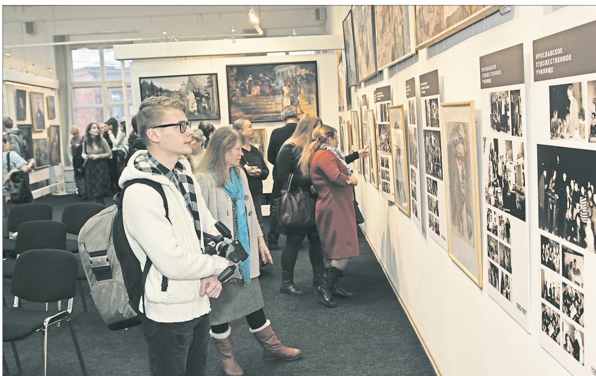
На открытии выставки «Русская школа».