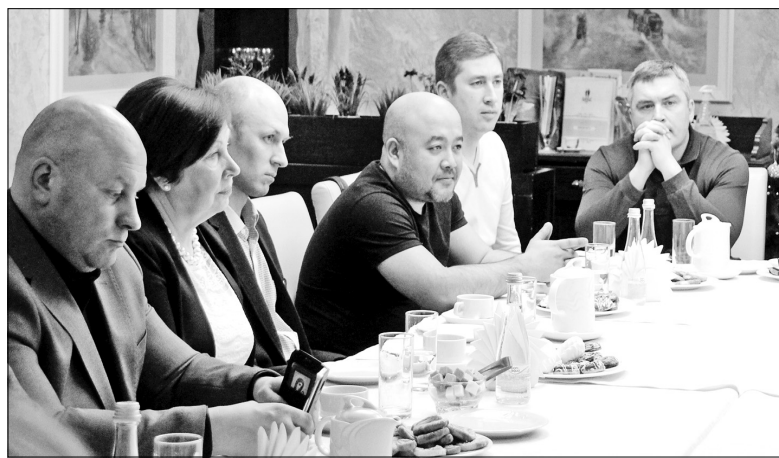
Вопросов к главе города на встрече было очень много.

Разговор начался с плохих дорог. Активные пользователи социальных сетей интересовались, почему их мало строят и плохо ремонтируют. Глава Ярославля пояснил: задача поднять ремонт магистралей на принципиально новый уровень поставлена и современные технологии это сделать позволяют. Владимир Слепцов отметил, что в планах нанести на всех дорогах новую пластиковую разметку, установить светофоры, которые, скорее всего, будут оборудованы камерами видеонаблюдения и фиксации скорости.