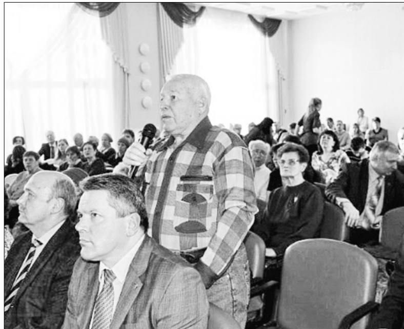
На встрече с жителями.

Депутаты муниципалитета Ярославля продолжают отчитываться перед горожанами о своей работе. 23 марта парламентарии встретились с жителями Кировского и Ленинского районов.