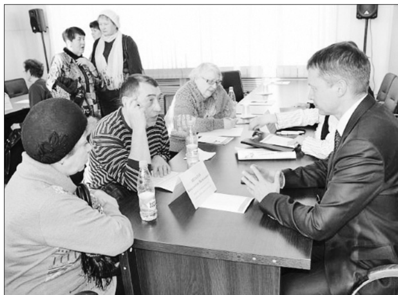
Во время депутатского приема.

Самым активным представителям районов — председателям общественных организа-