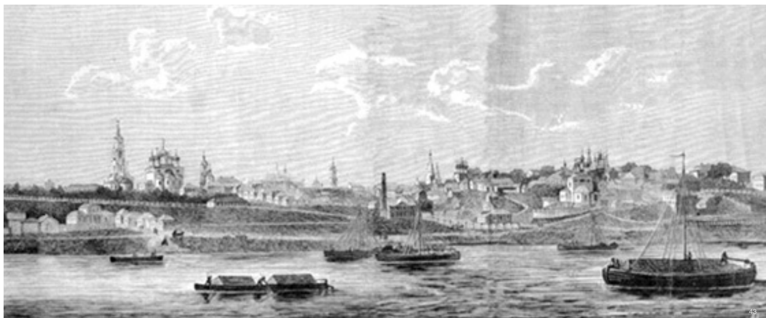
↓ Муром остается с человеком, где бы он ни был.