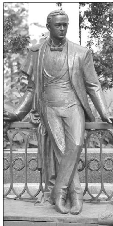
Памятник Леониду Витальевичу Собинову.