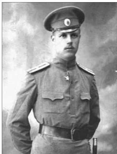
Федор Иванович Толбухин в 1915 г.