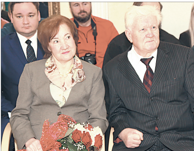
Золотые юбиляры Рогозины.