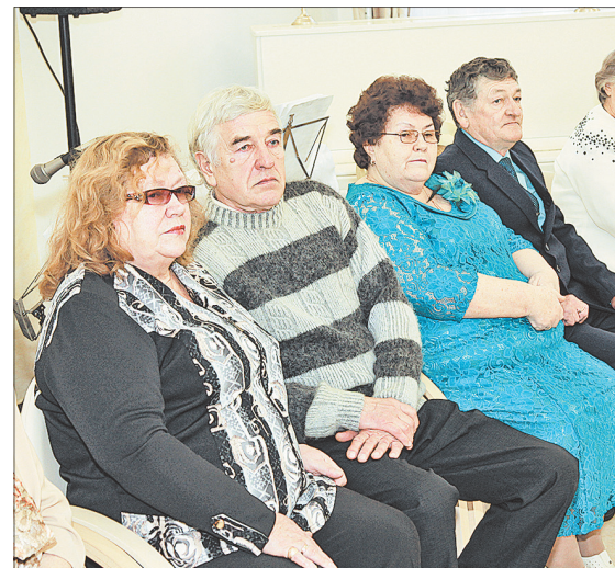
На церемонии чествовали 12 пар.