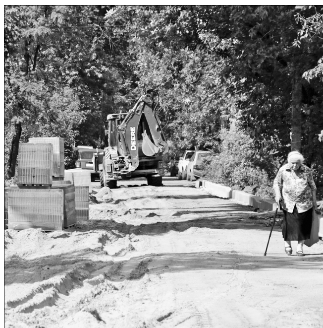
К сентябрю территорию приведут в порядок.