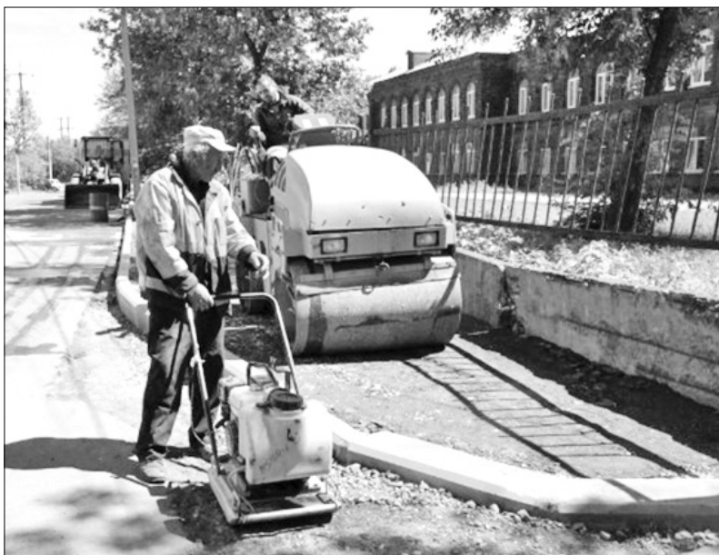
На улице Чехова к 1 сентября тротуар будет готов.

Анатолий КОНОНЕЦ, Ирина ШТОЛЬБА