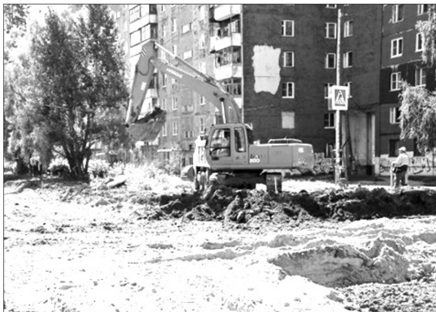
Закончить работы на улице Строителей планируется к 15 октября.