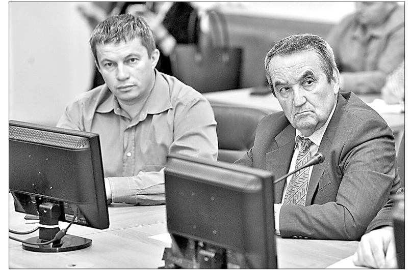
Представители общественности задали немало острых вопросов.

Однако общественники не удовлетворились планами и заинтересовались у заместителя генерального директора ЕКС, как устраняются недоделки прошлого года. Большая часть претензий касалась, конечно, проспекта Авиаторов. Да и укладка бордюрного камня на Магистральной ули-