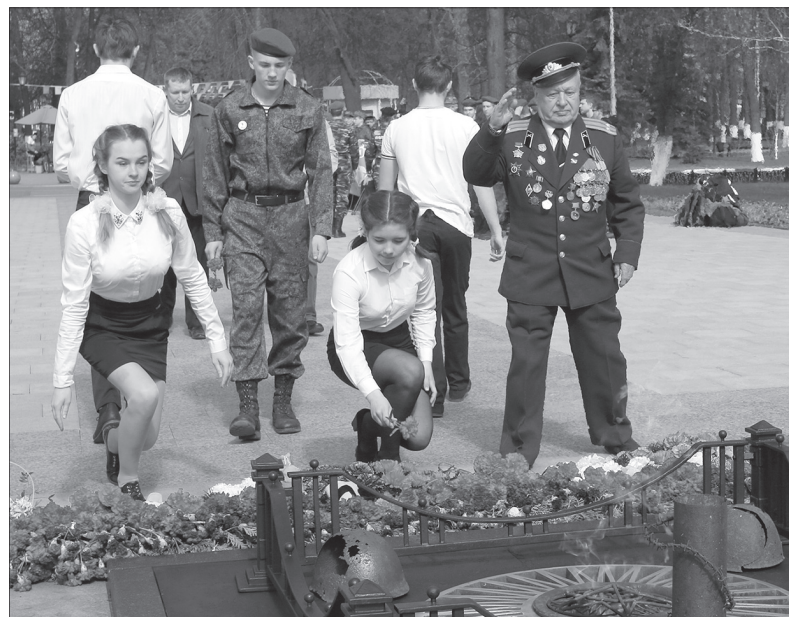
Возложение цветов к Вечному огню.