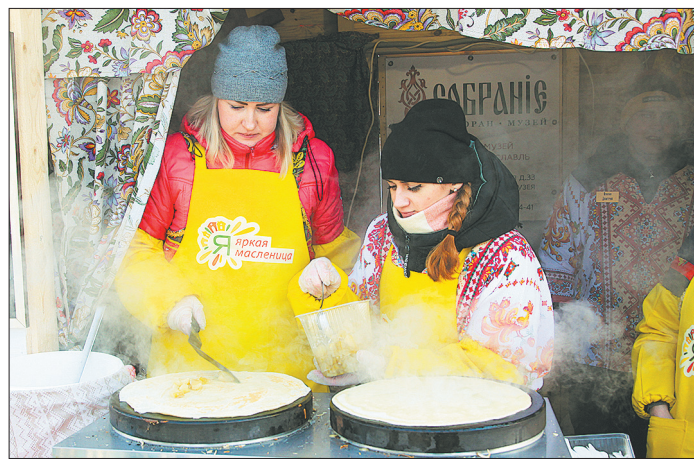
Главное лакомство – блины.