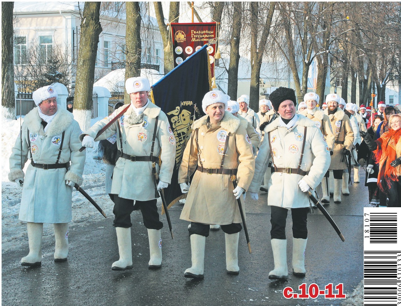
Гвардейцы Государыни Масленицы возглавили праздничное шествие.