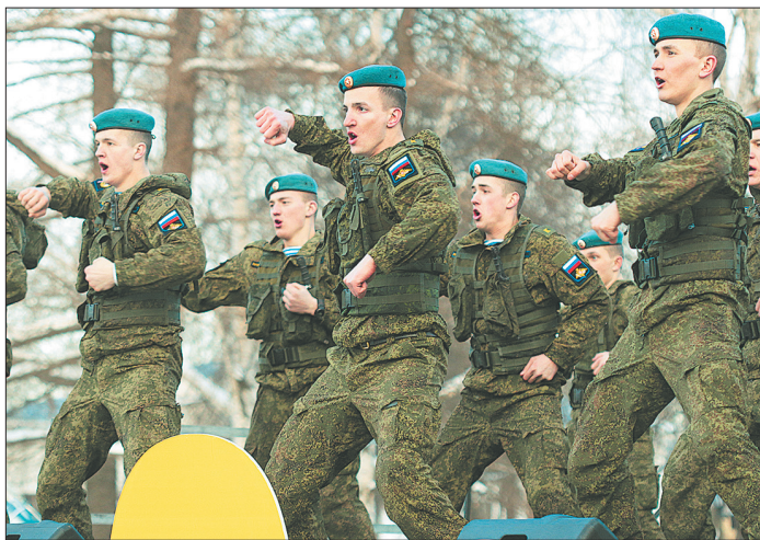
Показательные выступления курсантов Рязанского воздушно-десантного училища им. Маргелова.