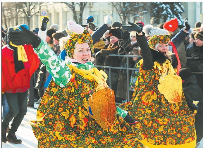
Зиму провожаем, весну встречаем.

В Ярославле в самом разгаре масленичные гулянья. Каждый день на городских площадках проходят фестивали, концерты, спортивные состязания, ярмарки-продажи изделий народных промыслов. И, конечно, везде пекут блины. А открылась Главная Масленица страны в Ярославле в воскресенье, 11 февраля.