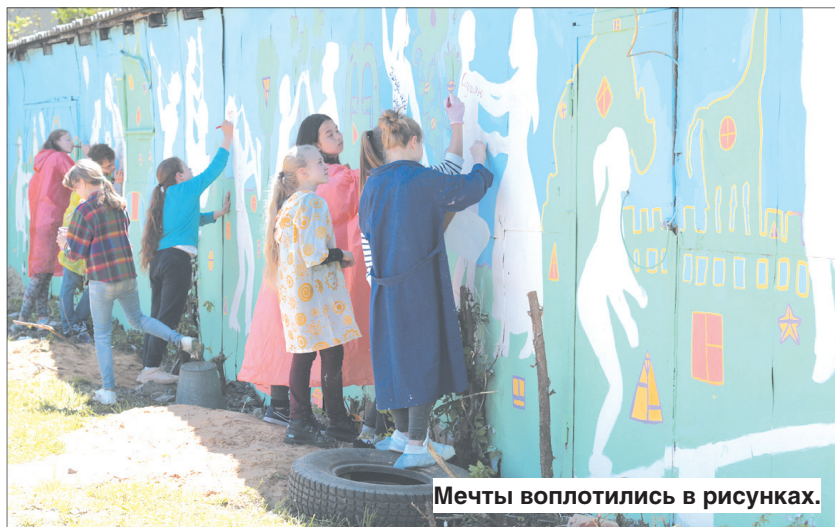
Мечты воплотились в рисунках.