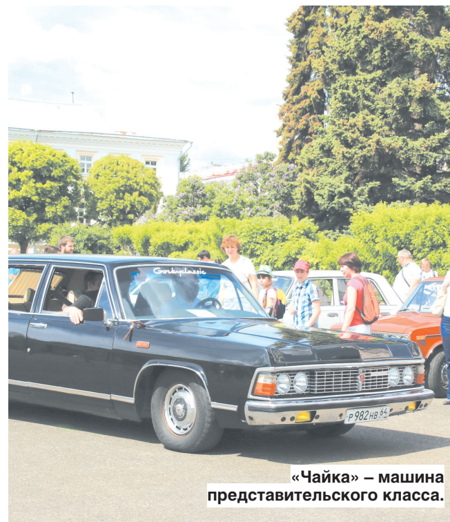
«Чайка» — машина представительского класса.

Ярославцы могли рассмотреть автомобили со