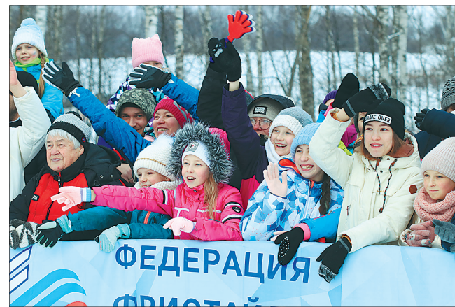
Болеем за наших.

Второй день хотя и не порадовал погодой, но подарил победы уже в командных соревнованиях. Из восьми команд, вышедших на старт, четыре пробилась в финал. Сильнейшей по сумме прыжков была призна-