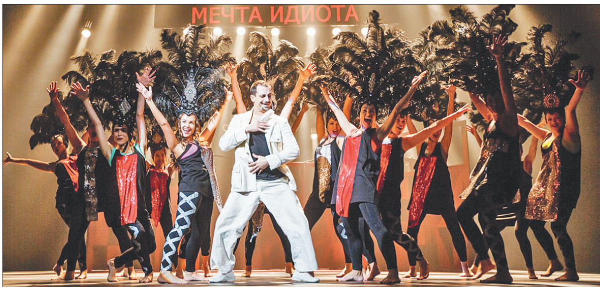
«Золотой теленок». Сцена карнавала.