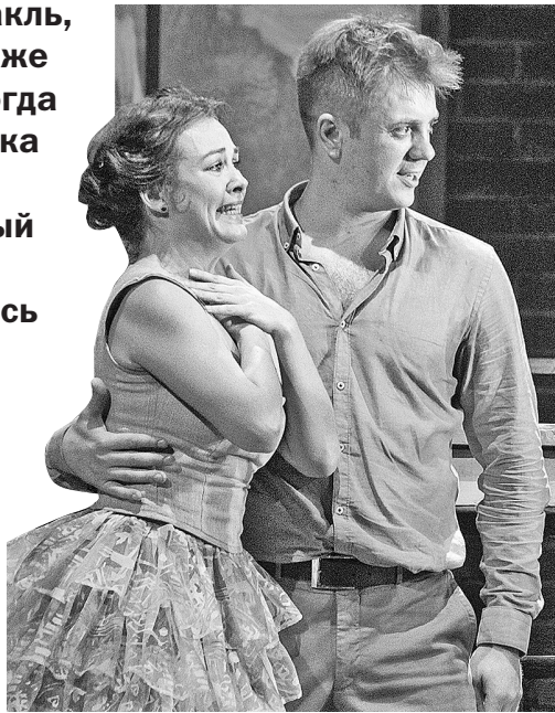
Марья Антоновна и Хлестаков.

– Хороший спектакль, динамичный, я даже не заснул. А уж когда началась дискотека и на сцене появился мохнатый розовый заяц... – со смехом делились впечатлениями зрители, выходя из театра имени Волкова.