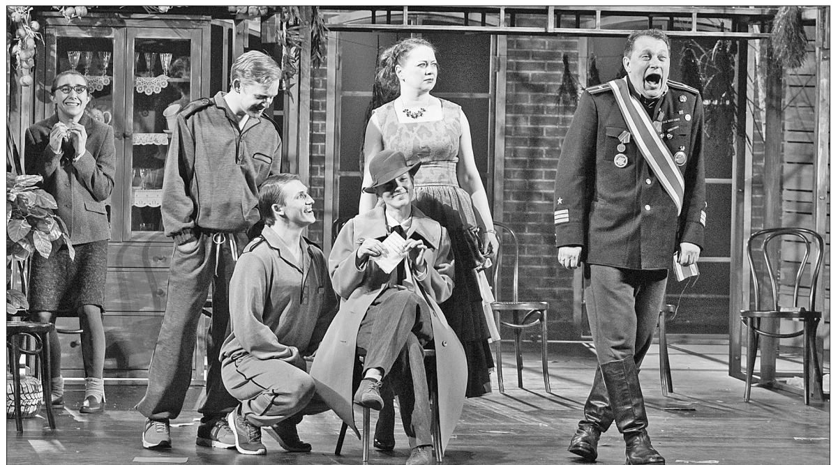
Почтмейстер вскрыл письмо Хлестакова, и уездный город узнал правду...