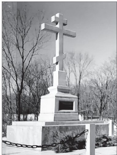
Ванино. Поклонный крест.