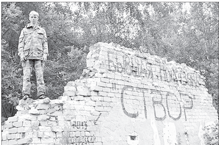
Чусовая. Лагерь «Створ».

30 октября, в День памяти жертв политических репрессий, на Леонтьевском кладбище состоялся поминальный митинг. А за несколько дней до этого в КСК «Вознесенский» прошел урок мужества и гражданственности. В зале присутствовали 47 членов Ассоциации жертв политических репрессий и 450 школьников. Подготовила и провела мероприятие, в этом году посвященное 80-летию начала «большого террора», при содействии департамента образования мэрии школа № 43.