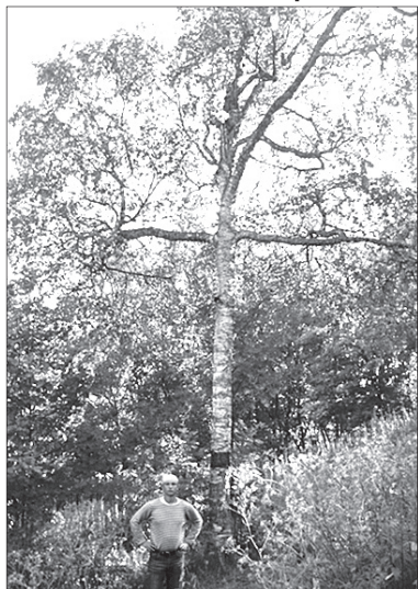
Гора Секирная. Береза-крест.