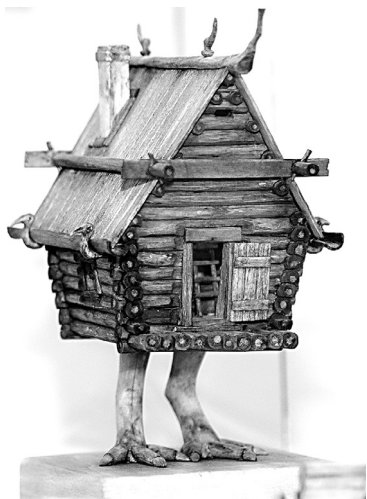
↓ Одна из трех избушек Бабы-яги.