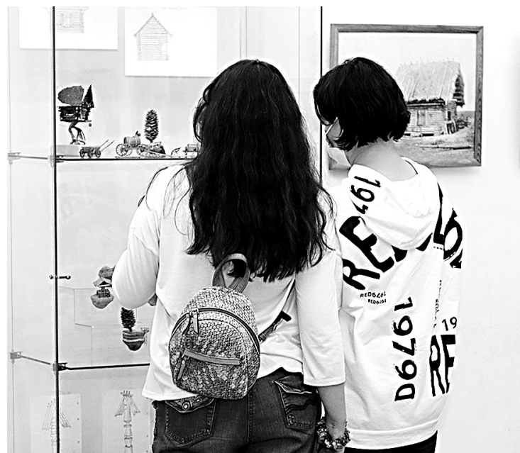
↓ На выставке.

двери можно разглядеть миниатюрную утварь! В избушке Бабы-яги горшочки – деревянные бусинки из набора, печь – толстый картон, покрашенный краской, травы – из технического льна. Всего домиков три. Один фантазия автора «поселила» на Вакаревском болоте, другой он подглядел в сказке «Морозко». Интересует мастера и крестьянский быт. В числе его работ можно увидеть телегу со старинного фото ижевского рынка, мельницу из костромского музея, водовозку с сидящим на ней грачом, телегу-одноколку о двух колесах, заонежскую соху... И даже, простите, заглянуть в деревенский... туалет.