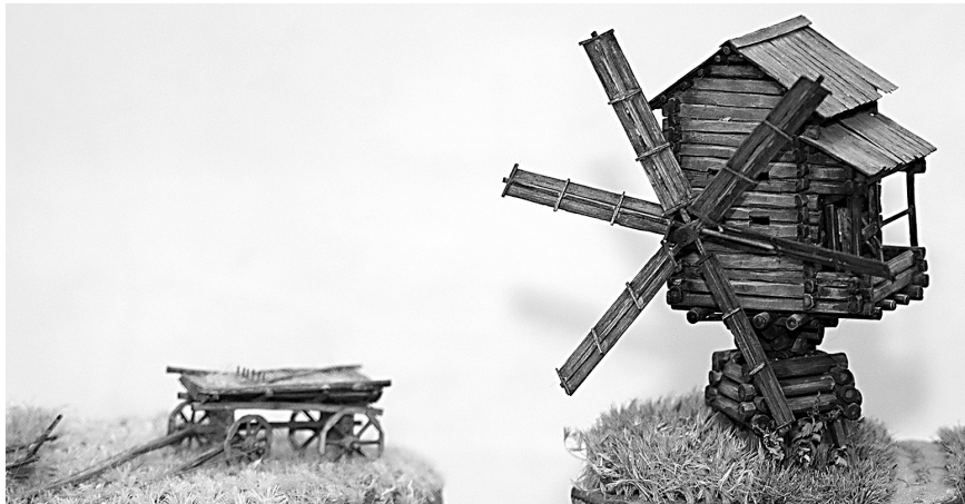
↓ Мельница из костромского музея.