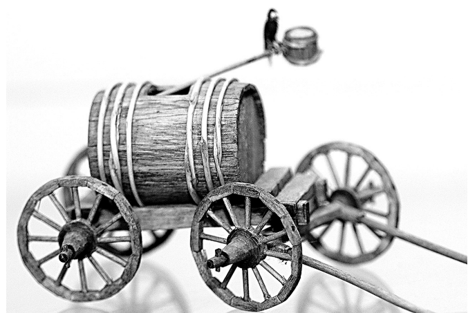
↓ Водовозка с сидящим на ней грачом.