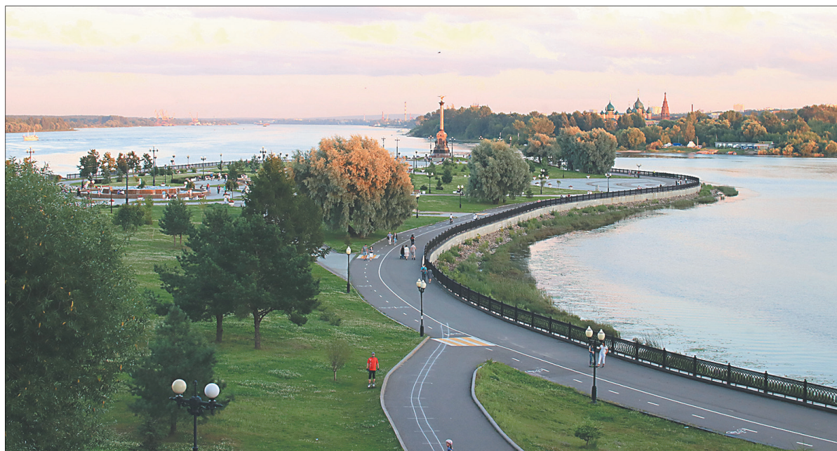
Вид на Стрелку.