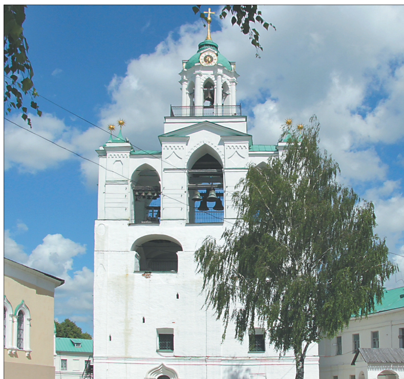
Звонница Спасо-Преображенского монастыря.

ницу можно подняться, непременно делает это. Ведь с верхнего яруса, с высоты 32 метров, открывается захватывающий вид на Ярославль. Подъем на самый верх происходит в несколько этапов.