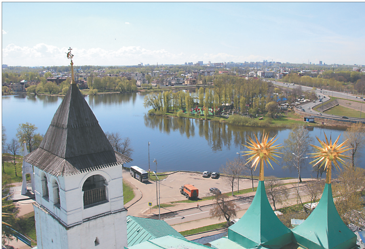
С верхнего яруса открывается удивительная по своей красоте панорама Ярославля.

Буквально каждый путешественник, узнав, что на звон-