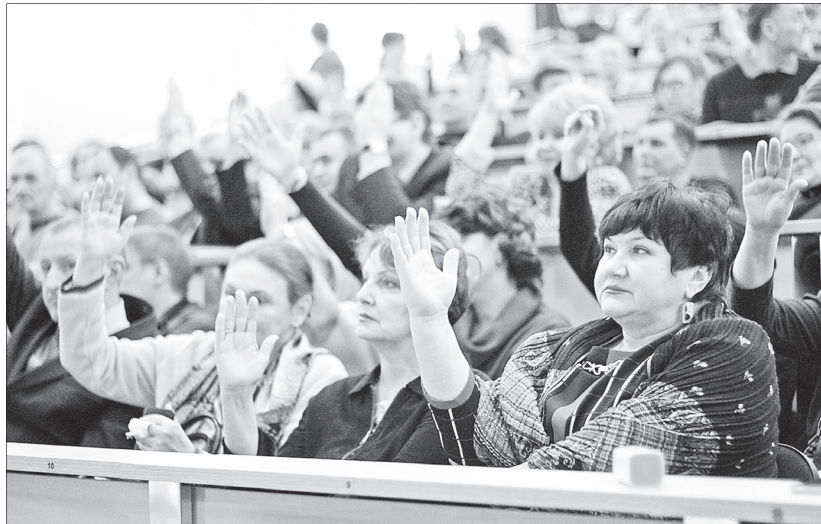
Большинство присутствующих проголосовали «за».

► Результаты публичных слушаний будут учтены при обсуждении изменений в «Правила благоустройства...» депутатами муниципалитета на ближайшем заседании. И в случае принятия нововведений народными избранниками уже к 1 июня предприниматели должны будут выполнить эти требования.