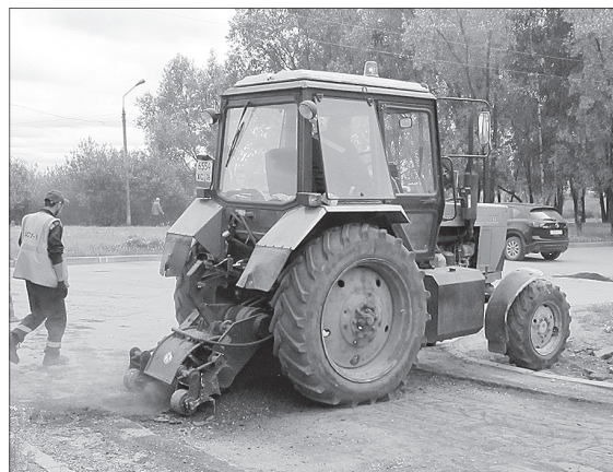
Улица Александра Невского.