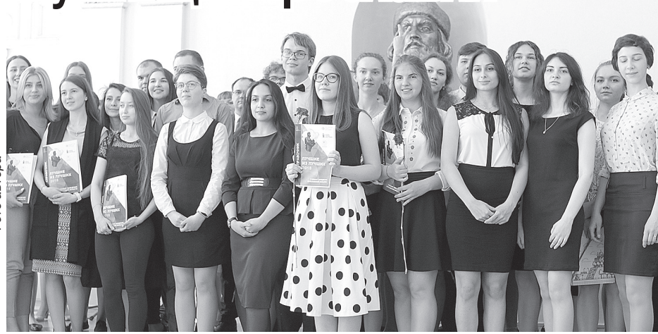
Лучшие из лучших выпускников.

19 июня в Большом зале мэрии собрались лучшие выпускники учебных заведений города: школ, техникумов, вузов.