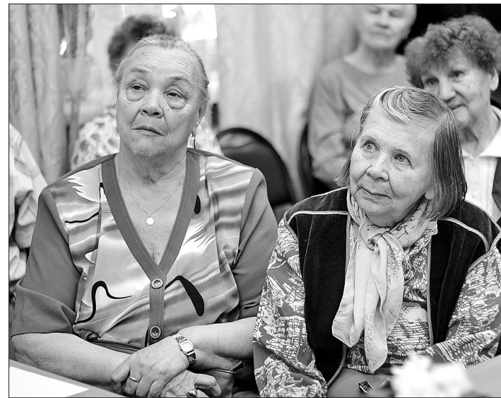
Наши преданные читатели.