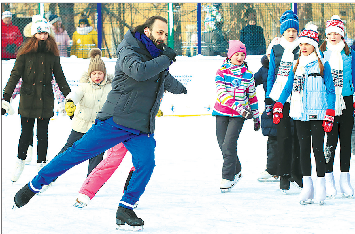
Мастер-класс от Авербуха.