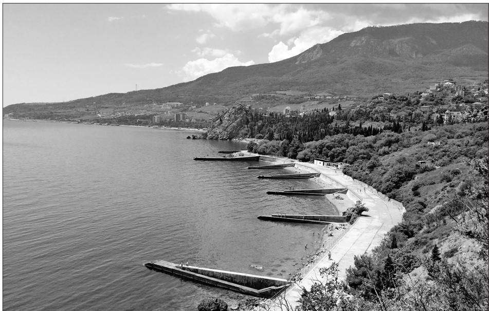
Крым. Вид на гору Аюдаг.