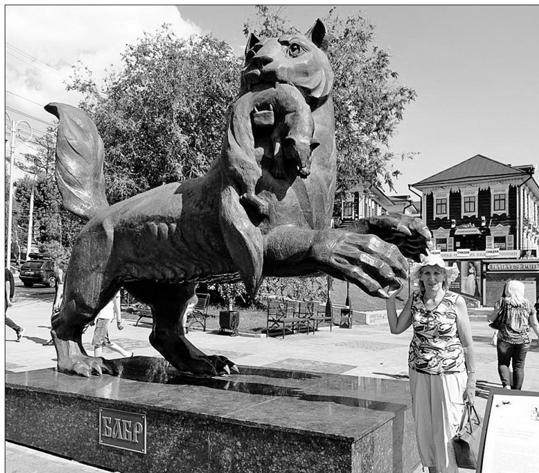
Бабр, по-якутски тигр, — символ Иркутска.

— В этом году я тоже поеду! Высокий курс евро? Конечно, он играет большую роль, но я знаю, где сэкономить и как набрать необходимую сумму. Какая разница, что у вас рваные кеды, если вы в этих кедах гуляете по Парижу? — признается женщина.