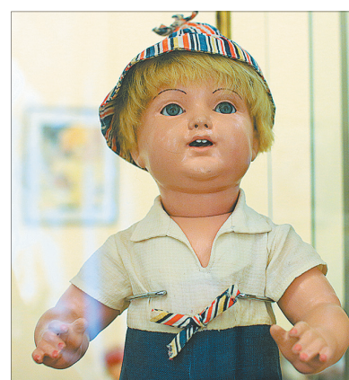
Кукла с флиртующими глазами, 1920 года, из Германии.

С ностальгией смотришь на Мальвин с голубыми и розовыми волосами ивановской фабрики игрушек и московской имени 8 Марта. Сейчас фабрики закрыты, а куклы стали редкостью.