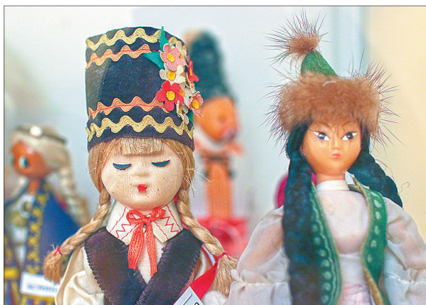
Куклы народов мира.