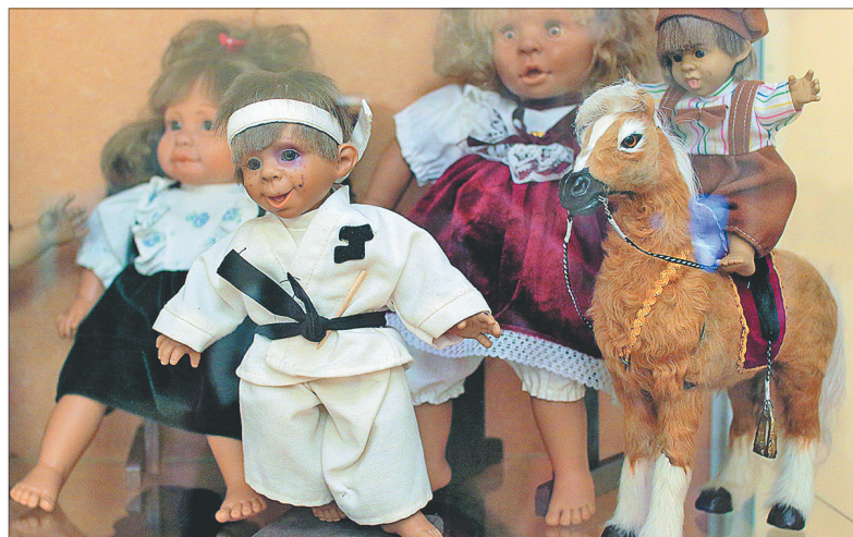
С некоторыми куклами в музее разрешают поиграть.