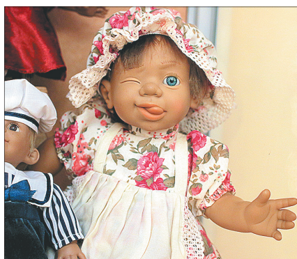
Такие куклы в одном экземпляре.