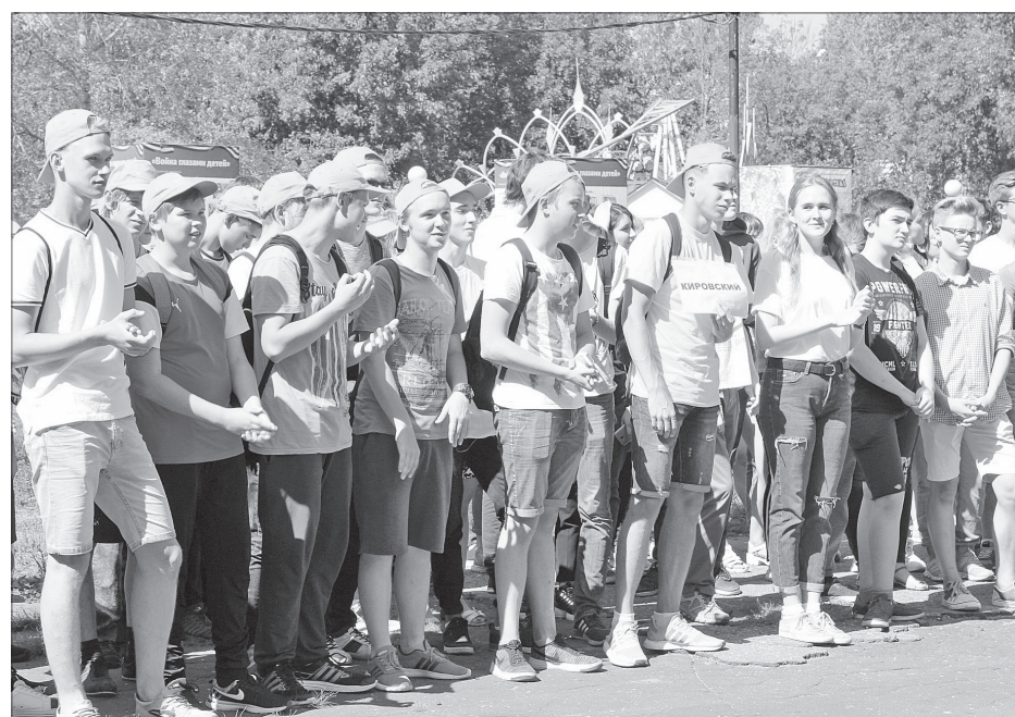
Торжественная передача смены.

10 августа завершила работу вторая смена «ЯрОтряда». В парке «Юбилейный» ребята передали эстафету третьей смене.