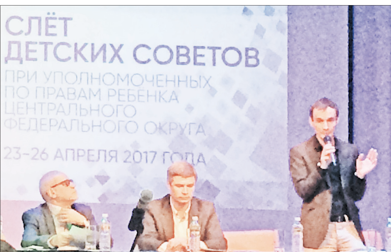
В слете приняли участие 200 делегатов.

В течение года члены детского общественного совета при уполномоченном по правам ребенка в ЦФО должны будут реализовать проекты слета – каждый в своем регионе, а в следующем году поделиться опытом их реализации.