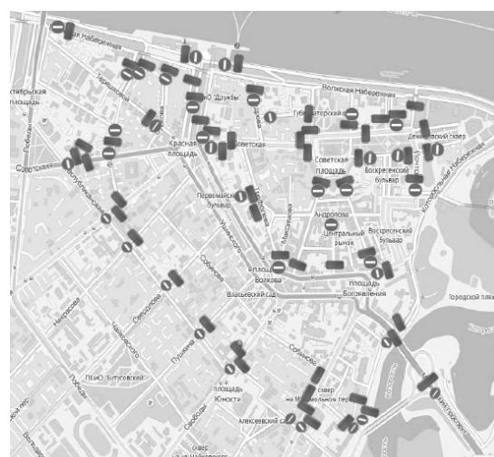
Схема расстановки временных дорожных знаков для ограничения (прекращения) движения транспортных средств 09.05.2023

Приложение к приказу директора департамента городского хозяйства от 03.05.2023 № 76