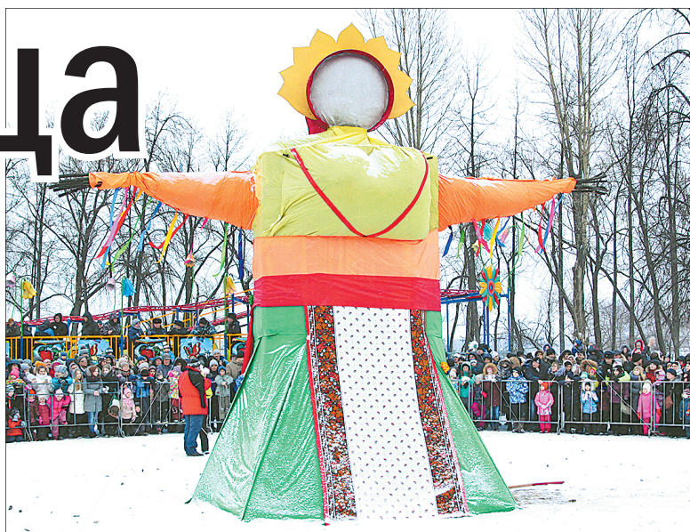
Народу на масленичный костер в парке на Даманском собралось видимо-невидимо.