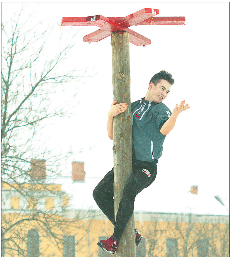
Добраться до вершины столба – русская забава. Стадион «Спартаковец».