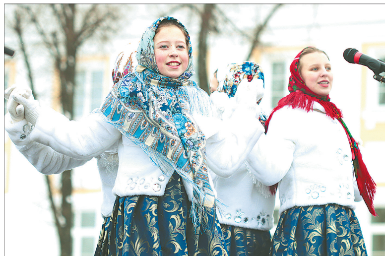
Масленица без песен не бывает.