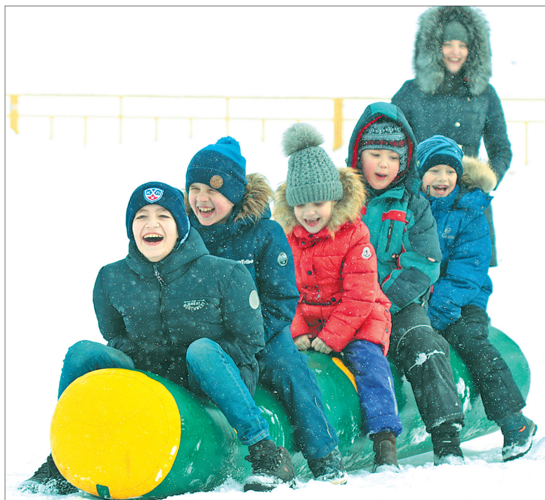
Масленичные забавы. Стадион «Спартаковец».