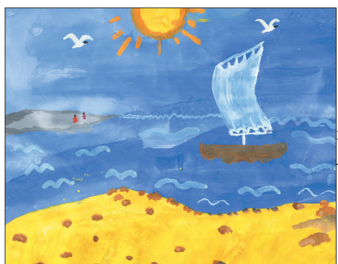
Рис. Дмитрий Талачиков