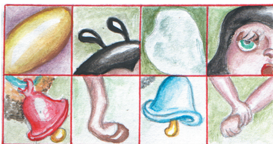
Из восьми квадратиков с фрагментами, взятыми из разных рисунков, только один верный. Найдите его.

Когда обнаружилось, что Жужа не вернулась в улей, вся семья отправилась на ее поиски. Долго пчелки искали малышку и уже не надеялись ее найти, как вдруг у одного из братьев Жужи зазвенел