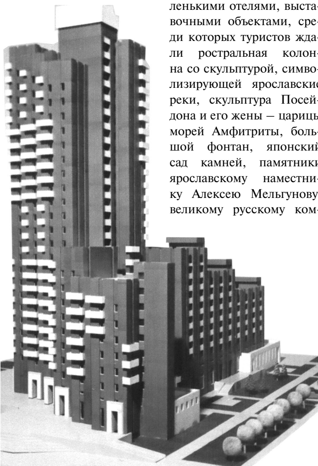
Высотный жилой дом в Дзержинском районе. Институт ЦНИИЭП жилища. 1980 г. Архитектор С. Чалая.