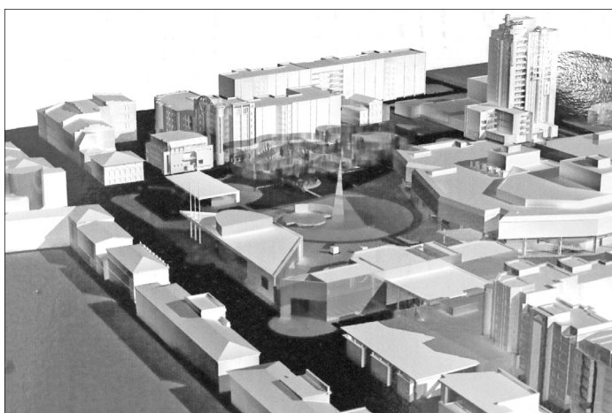
Площадь Юности. Эскизный проект реконструкции. 2006 г. ООО «Центрпроект». Архитекторы Р.В. Гарифуллин, О.В. Кротов и С.П. Ловыгин.