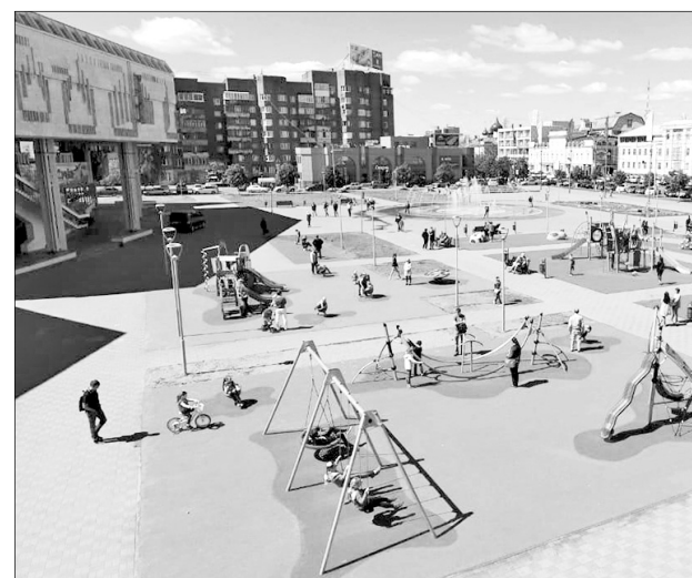
Площадь Юности. 2018 г.