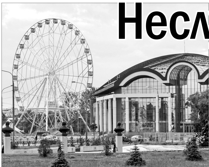
Набережная Которосли сегодня. КЗЦ «Миллениум».