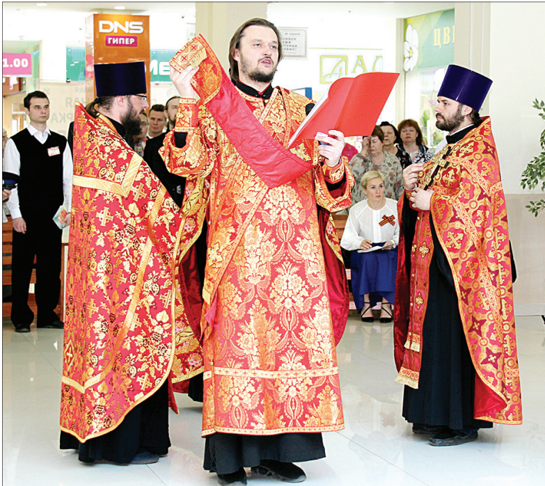
Среди организаторов – Ярославская епархия.

XVI православная выставка-ярмарка «Мир и клир» работала в Ярославле с 8 по 13 мая