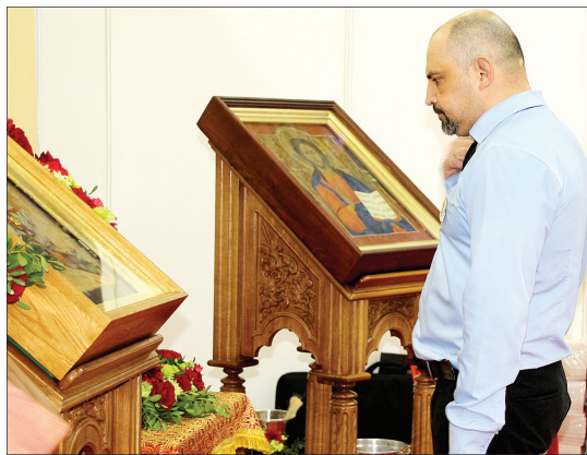
Верующие поклонились святым мощам.

мощей. Уже в первый день к ним на поклон потянулись вереницы православных.