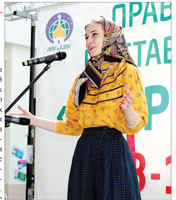
На открытии выставки.

Ежедневно проходили концерты и встречи-беседы со священниками: «О любви, браке, детях и жизненных невзгодах», «О правильном поименовании почивших близких», «О саморазвитии», «О современной женщине и семейном очаге».