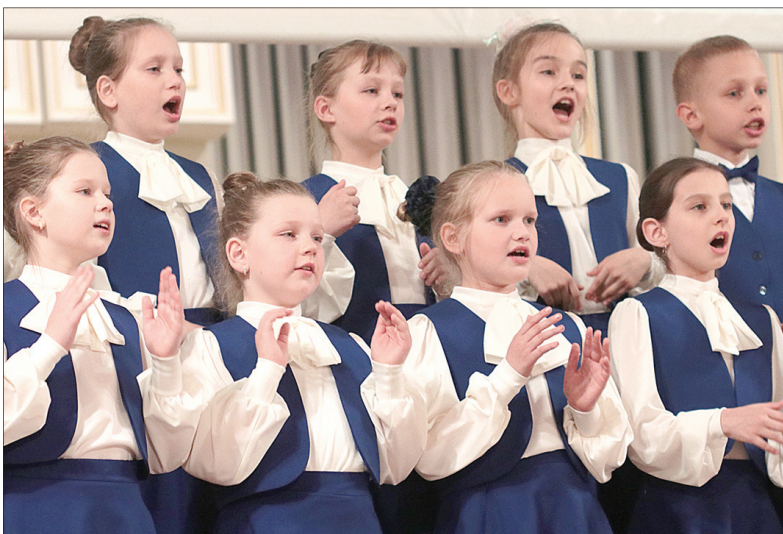
Хор младших классов ДШИ им. Алмазова.

В этом году 60-летний юбилей отмечает детская школа искусств имени Николая Алмазова. Праздничный вечер прошел 29 апреля в Ярославской филармонии