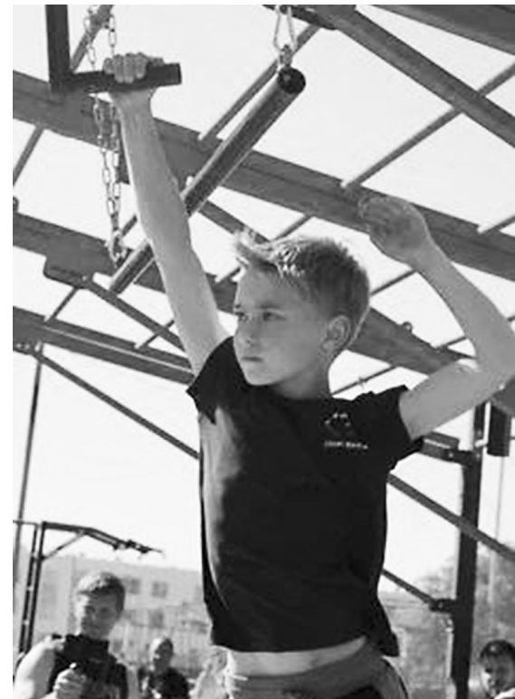
↓ А вам слабо?

Самыми сложными из препятствий были карнизы. Для их прохождения требуется владеть