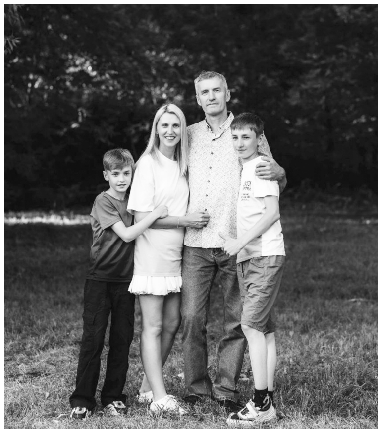
↓ Мама, папа, брат и я – спортивная семья.