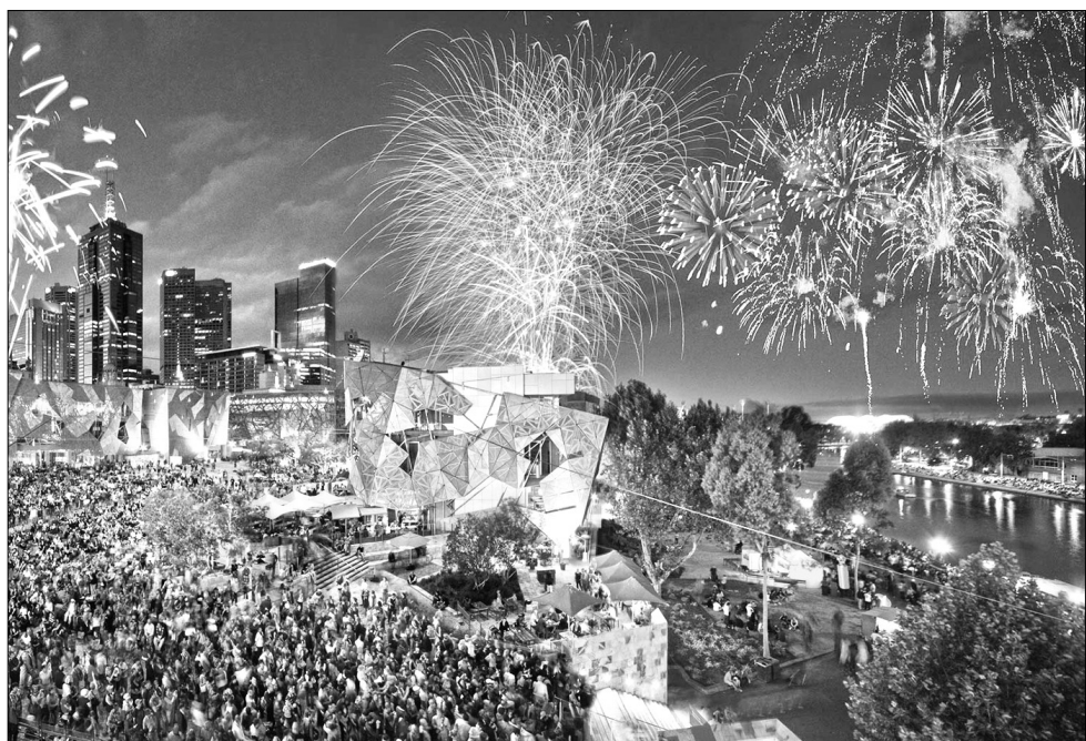
Новый год в Австралии.

Праздновать Новый год в Таджикистане начали только с приходом советской власти. До этого таджики в ночь с 21 на 22 декабря – самую длинную в году – отмечали начало зимы. Сейчас