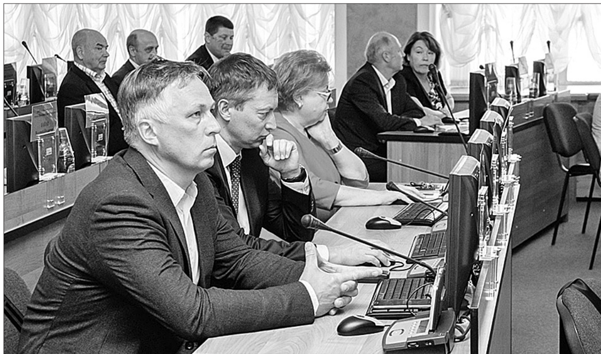
На заседании муниципалитета.