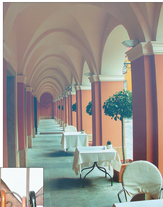
«Итальянский уголок в Новой Старой Варшаве».