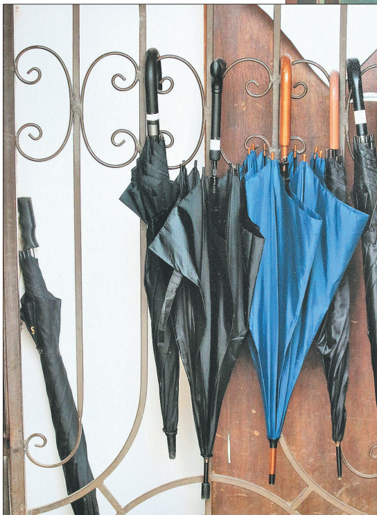
«Из жизни зонтиков».

разных городах и странах мира. Его фотографии в частных коллекциях в США, Канаде, Франции, Италии и других странах.